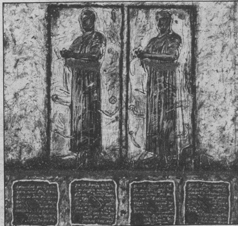
« Το γράμμα που δεν έφτασε » του Γιάννη Ψυχοπαίδη ή καλύτερα το σχόλιο για ένα γράμμα που δικαιούται να μη φτάσει ποτέ στον αποδέκτη

που δεν έφτασε » με έργα που ξεκινούν το 1977 και φτάνουν ως τις μέρες μας. Σ' αυτή τη σειρά χρησιμοποιούνται υλικά που πρώτη φορά μπαίνουν στη ζωγραφική του Ψυχοπαίδη, δίχως όμως να σημαίνουν και εξέλιξη ή απόκλιση των μεθόδων και των μέσων του, δεδομένου ότι το