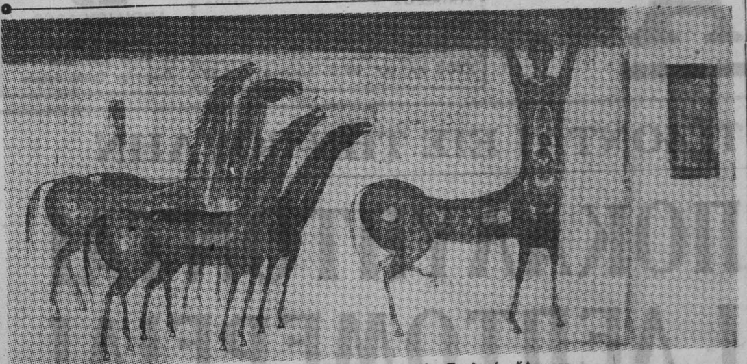
★ Πίνακας του Μάριο Βατζιά, από την έκθεσή του στην Γκαλερί «Άστορ»