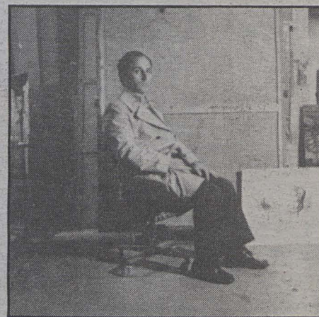
Πάνω, φωτογραφία του Δημήτρη Μυταρά ως μοντέλου. Εδώ τον ενδιαφέρει η στάση που κάθεται. Αριστερά, η πάνω φωτογραφία «χρησιμοποιήθηκε» αργότερα από τον ζωγράφο για τα έργα της περιόδου 1971-1976 με τίτλο «Επιτάφια πορτρέτα».

δες φωτογραφίες, από σπίτια, ανθρώπους και αντικείμενα. Έτσι είδα πράγματα τα οποία είχα συνηθίσει να μη βλέπω εδώ και χρόνια. Το αρχείο αυτό το πλουτίζω ερασιτεχνικά ακόμη και σήμερα, μολονότι προ πολλού έχω σταματήσει να χρησιμοποιώ τη φωτογραφία με την έννοια του ντοκουμέντου. Και αυτό, διότι πιστεύω ότι η φωτογραφία δεν αντιπροσωπεύει καμία ιδιαίτερη λύση στα ζωγραφικά προβλήματα». Και συνεχίζει: «Για να ξεκαθαρίσουμε τα πράγματα, είναι αλήθεια ότι η ωμή γλώσσα του φωτογραφικού ντοκουμέντου ασκεί μία κριτική, είτε πολιτική, είτε κοινωνική. Αυτό είναι ακριβώς το στοιχείο που μεταφέρεται στη ζωγραφική μέσω της φωτογραφίας».