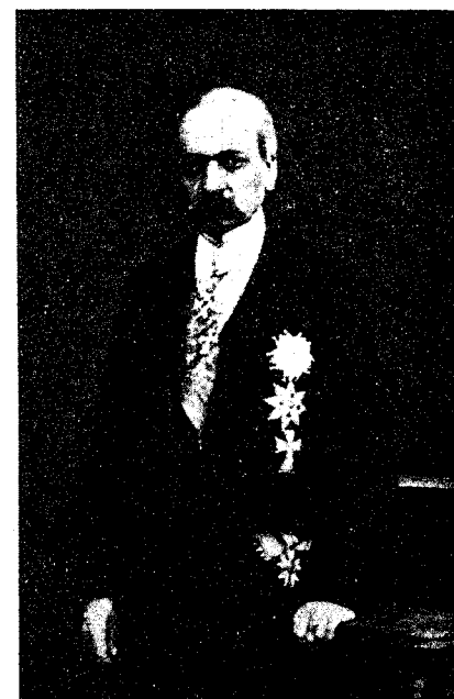
Θεοδύβουλος Ζαΐμης (πρωθυπουργός).

τῶν ἐχθρῶν, ἧς πλείστον καὶ αὐτὸς μετέσχε. τῷ 1823 μετέσχε τῆς ἐν Μεσολογγίῳ ἐκδιώξεως τῶν ἐχθρῶν καὶ τῷ 1824 ἠγωνίζετο περὶ τὰς Πάτρας, ὅτε ἀρξαμένου τοῦ ἔμφυλλίου πολέμου ἀπεσύρθη εἰς Κερπινῆν, ἔνθα ἐκβιασθέντος καὶ ἀρπαγέντος τοῦ οἴκου αὐτοῦ ὑπὸ τῶν σιφῶν τοῦ Γκούρα καὶ Καραϊσκάκη ἔφυγεν εἰς Δίβρην καθεῖθεν διὰ Κουνουπελίου εἰς Στερεὰν Ἑλλάδα, ἐπόθεν κρυπτόμενος ἐπανῆλθεν ἐπὶ τῆς εἰσβολῆς τοῦ Ἰμβραῖμ. Τῷ 1826 ὡς πρόεδρος τῆς Κυβερνήσεως ἔδειξεν Ἀριστείδου καρδίαν ἀναγνωρίσας