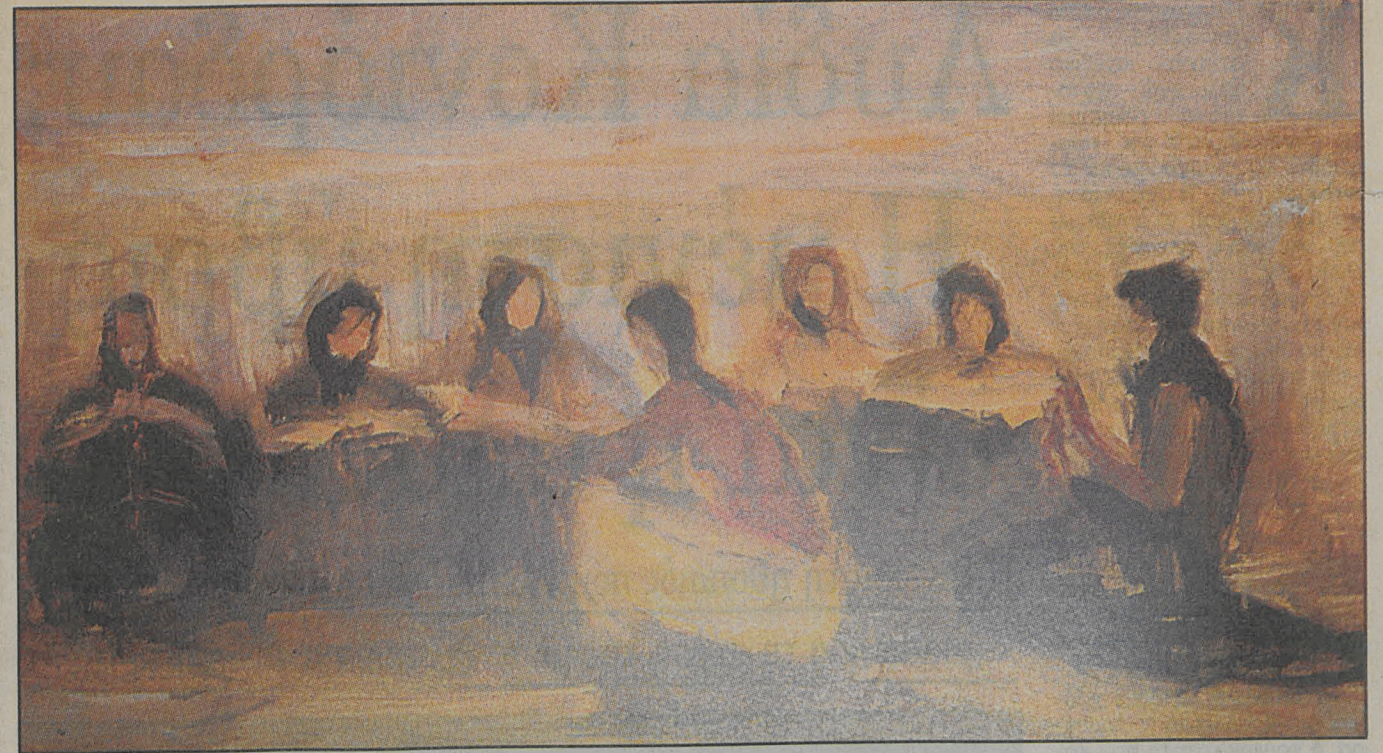
Περικλή Βυζάντιου: «Γυναίκες των Δελφών». Ελαιογραφία του 1940.

Οι πρώτες ζωγραφιές. «Δεν αποφάσισα να γίνω ζωγράφος: ζωγράφος ήμουν από μικρός. Ζωγράφιζα και σχεδίαζα ό,τι έβλεπα γύρω μου: τον καστανά, τον στραγαλατζή, τους σκύλους, τη γάτα του σπιτιού, το άλογο του πατέρα μου που του το έφερναν το πρωί που ξεκίναγε με τον υπασπιστή του να πάει στο Σύνταγμα του Πυροβολικού που διοικούσε. Ολα αυτά, βέβαια, άρεσαν στους δικούς μου, αλλά με τη συμφωνία ότι θα έδινα αργότερα εξετάσεις στη Σχολή των Ευελπίδων ή των Δοκίμων, μια κι αυτό απαιτούσε η παράδοση της οικογενείας. Εγώ όμως δεν είχα καμιά διάθεση να φορέσω στολή και να κρεμάσω ένα σπαθί στη μέση. Είχα