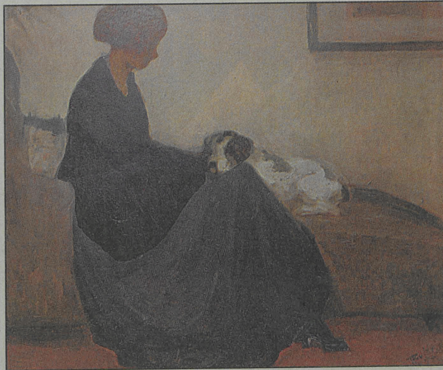
«Η Κυρία με το Σκύλο», έργο του 1915 του Π. Βυζάντιου.

Ο Βυζάντιος δεν κρατούσε συστηματικά αρχείο, «δεν έδειχνε καμία αξία στην επιφανειακή επιμελημένη συσσώρευση νέων ανεπεξέργαστων ιδεών, προτιμούσε