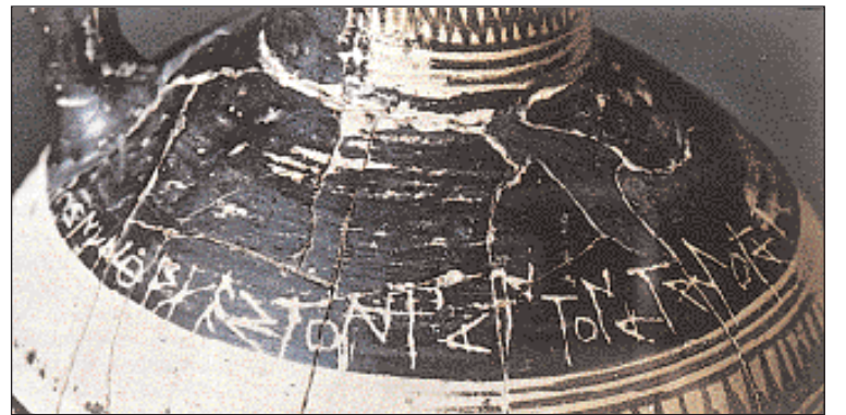
▼ Η Ονοχόη του Διυίλου. Τρίτο τέταρτο του 8ου αι. π.Χ. Η έμμετρη επιγραφή στη ράχη του αγγείου «Όποιος από τους χορευτές πιο ανάλαφρα τώρα χορεύει, σ' αυτόν ανήκω», αποτελεί το αρχαιότερο γνωστό δείγμα ελληνικής αλφαβητικής γραφής. Αθήνα, Αρχαιολογικό Μουσείο.

Ευχαριστούμε τους επιστήμονες που υπογράφουν τα κείμενα του αφιερώματος και όσους ευγενικά μας παραχώρησαν το δικαίωμα χρήσης του εικονογραφικού υλικού. Επίσης, την κυρία Αλεξάνδρα Καρέτσου, διευθύντρια του Αρχαιολογικού Μουσείου Ηρακλείου, η οποία βοήθησε αποφασιστικά από την αρχή.