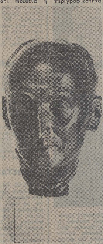
★ Προτομή τού Μπερξόν

'Η έκθεση αυτή δέν μπορούμε νά πούμε πως μάς προτείνει κάτι τό νέα ή μπορεί νά είναι ή πηγή μιάς αναθεώρησης. 'Από τήν άλλη μπορεί κανείς μέσα από έργα — άκόμα και τά λιγώτερο πετυχημένα — νά γνωρίσει περισσότερο τούς τρόπους και τά μέσα τής δουλειάς τού 'Απάρτη. Έτσι, διακρίνει κανείς ότι πουθενά ή περιγραφικότητα