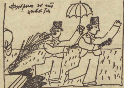
Ξεαρση τήν χαβούζα

πνικτική άτμόσφαιρα. "Όλη αυτή ή Παροτρραγική κατάσταση, που άρχισε με επίσημα ύπουργικά έγκαινια τής χαβούζας και συνεχίζεται ως τώρα με τίς υπερχειλίσεις και άποφράξεις του φρεατίου, ένέπνευσε στον διακεκριμένο "Έλληνα ζωγράφο "Άλέκο