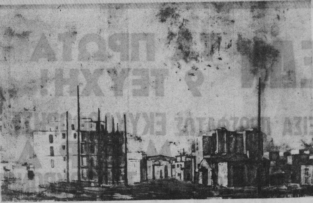
★ «Κωνσταντινουπόλεως»: έργο του Λ. Βενετούλια, πού έκτίθεται στην "Άστωρ