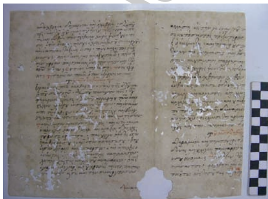
Εικ. 20. Τμήμα από κείμενο εξορκισμού, όπου διαφαίνεται το υδατόσημο.