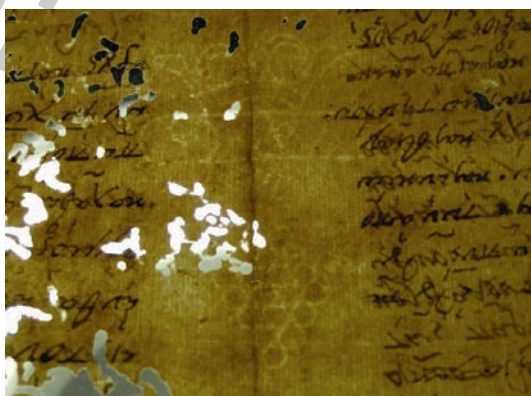
Εικ. 21. Λεπτομέρεια του εξορκισμού, όπου διαφαίνεται το υδατόσημο.