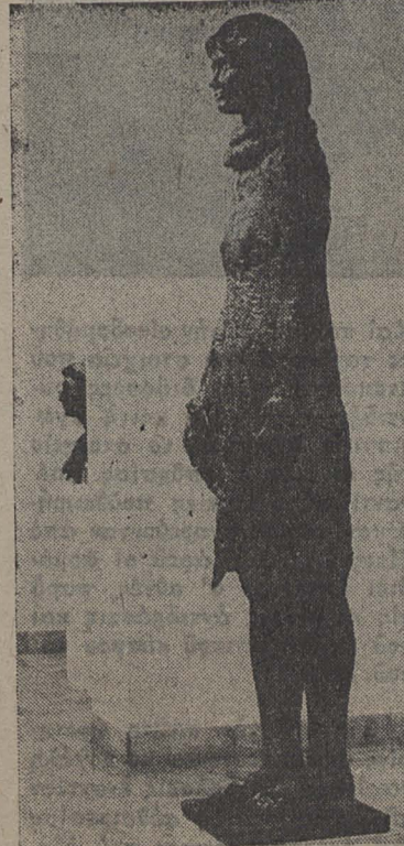
Έργο του Μέμου Μακρή.

— Εκείνο που διαπιστώνω είναι η ύπαρξη πολλών γκαλερί. Αυτό δείχνει πως υπάρχει ένα κοινό — περιορισμένο ίσως άφουκνείται μόνον σε αίσουσες τέχνης — που όμως δείχνει μεγάλο ενδιαφέρον. Στην Ελλάδα ακόμη υπάρχει ένα δημιουργικό ανθρώπινο δυναμικό και αυτό φαίνεται από τη συμμετοχή του με Διεθνείς Μπιενάλε. Όμως πρέπει να δημιουργηθούν οι κατά-