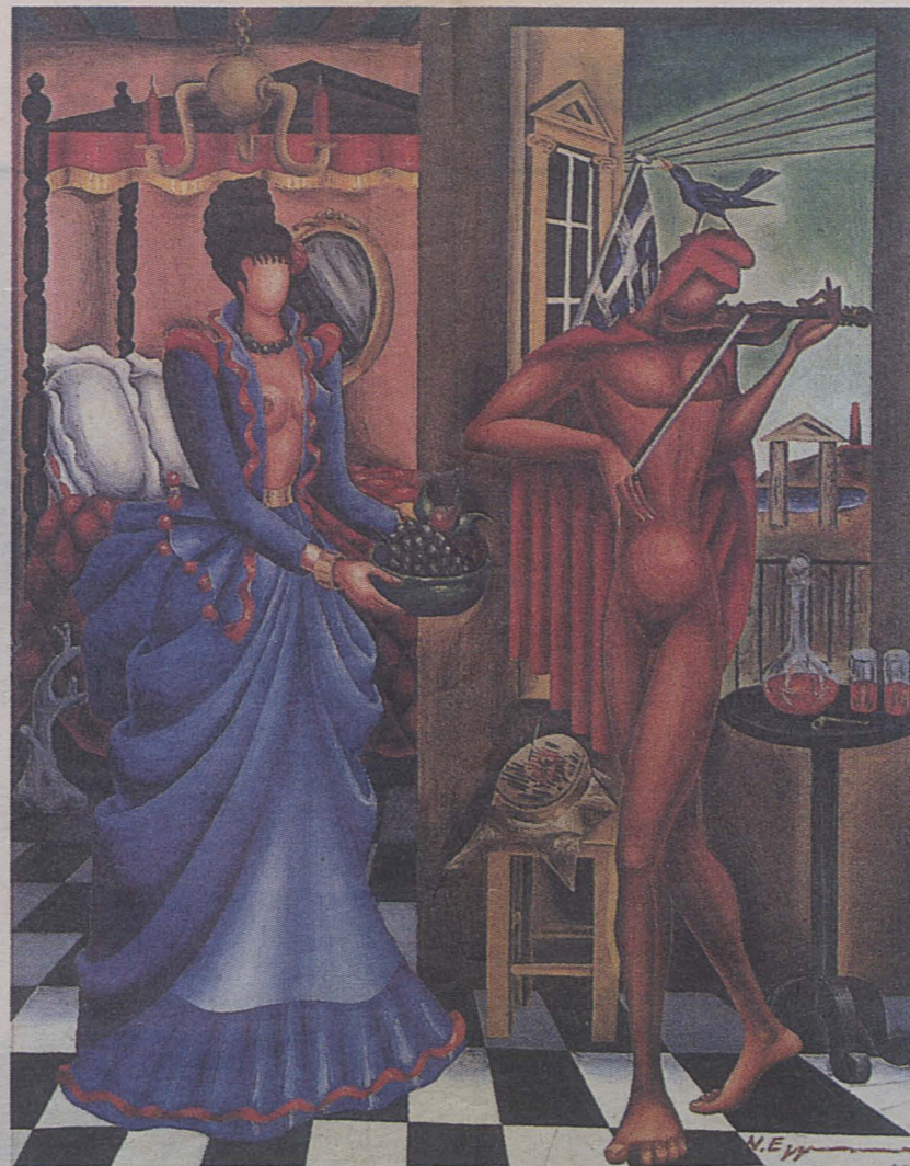
Επιστροφή του Οδυσσέα, 1947, λάδι σε μουσαμά, 58X45 εκ.