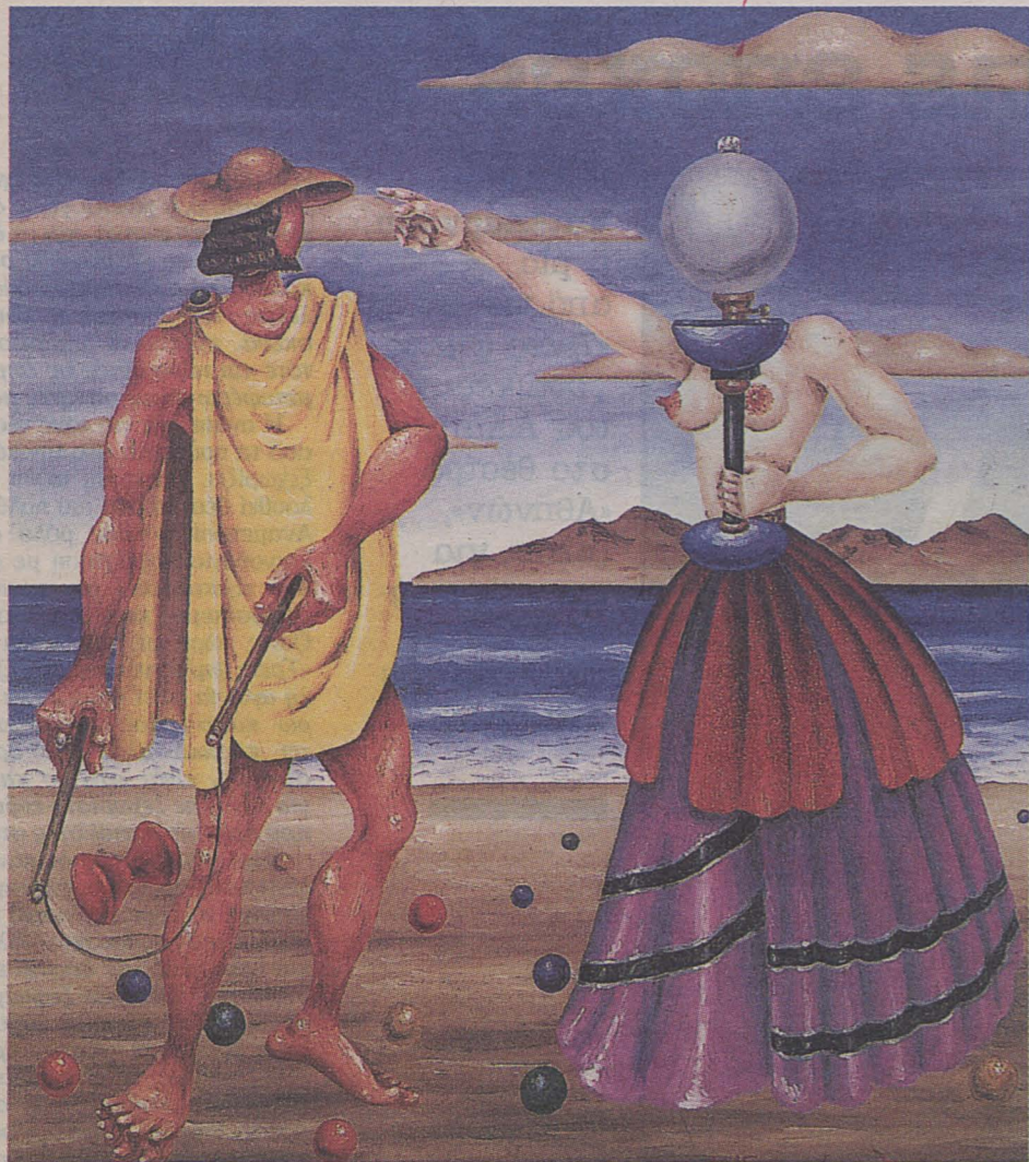
Ιάσων και Μήδεια, 1970, λάδι σε μουσαμά, 55X46 εκ.