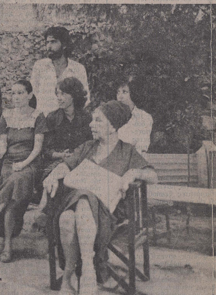
... ολόκληρο το έργο, αλλά άπλά να δείξει πόσο είναι η σκηνοθεσία. Πολλοί θα με κατηγορήσουν γιατί το έργο δεν είναι μεταφρασμένο σε άγνη και φιλολογική δημοτική, για να δώσει αυτό που θεωρούμε ευγενικό καί κλασικό. 'Η γλώσσα, στην όποια μετέφρασαν τό 1900 την τραγωδία οι δημοτικιστές δεν είναι πιά ή γλώσσα που θαυμάζεται από τους σημερινούς λογιτέχνης. Σζύλητησα επί πολύ, με πολλούς φιλόλογους έένους και 'Ελληνες για να μάθω αν όρισμένες φράσεις είναι ποιητικές ή, εκλισησέ της όμιλουμένης, που χρησιμοποιέσαν οι ποιητές. Οι πιο πολλοί,

μια τελευταία έρώτηση. Ποιά ήταν ή κύρια πρόθεση που είχατε όταν μελετούσατε τις «Τρωάδες»; Ποιά από τις ιδέες του έργου θέλατε να τονίσετε περισσότερο;