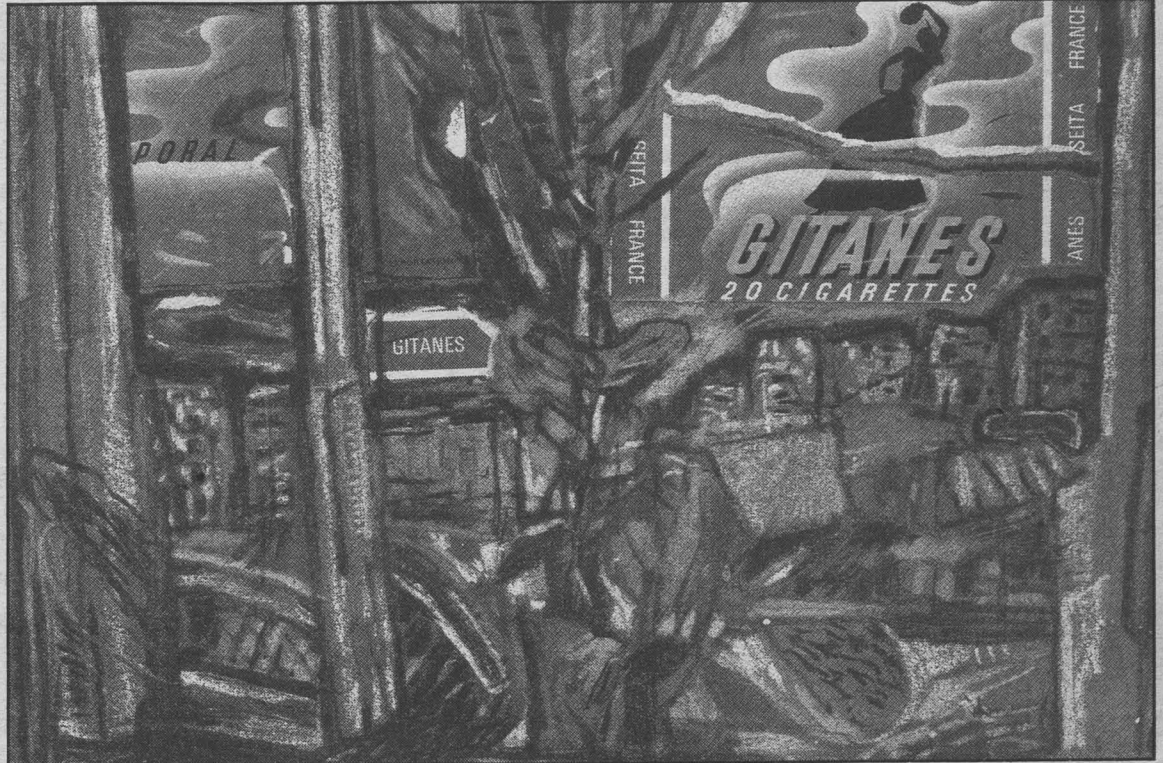
Από τη σειρά «Πόλη», του Γιάννη Ψυχοπαίδη στη γκαλερί «Ζουμπουλάκη»

του Χαρβαλιά η εμμονή του ν' ανιχνεύσει το χώρο του.