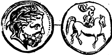
Νομίσματα τῶν Κελτῶν, ἀπομιμήσεως τῶν τοῦ Φιλίππου

Πρὶν ὅμως διαπεραιωθῆ εἰς τὴν Ἀνατολήν, ἔκρινε φρόνιμον καὶ ἀσφαλίστη τὴν ἀρχὴν αὐτοῦ ἐπὶ τῶν Ἰλλυριῶν, τῶν Παιόνων καὶ τῶν Θρακῶν, οἵτινες, οἰκούντες πρὸς δυσμὰς, πρὸς βορρᾶν καὶ πρὸς τὸ ἀνατολικοβόρειον τῆς Πέλλης, εἶχον μὲν ὑποταχθῆ εἰς τὸν Φίλιππον, ἀλλὰ καθ' ὅλας τὰς πιθανότητας δὲν ἤθελον ὑποκύψει προθύμως εἰς τὸν νέον αὐτοῦ διάδοχον, ἐὰν δὲν ἐλάμβανον πείραν τῆς ἰσχύος αὐτοῦ.