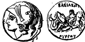
β' (Κεφαλὴ Ἀχιλλέως. Θέτις ἐπὶ ἰσχυράμπτου κρατῶσα τὴν ἀσπίδα τοῦ Ἀχιλλέως).