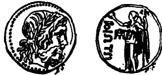
(Ζεὺς καὶ Νίκη)