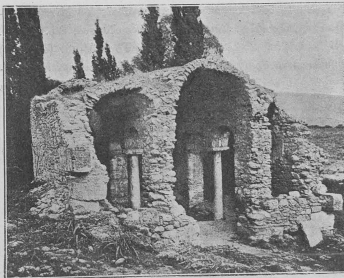
Εἰκ. 164. Ἀπομικ τοῦ ναοῦ τῆς Παναγίας Γουδῆ.