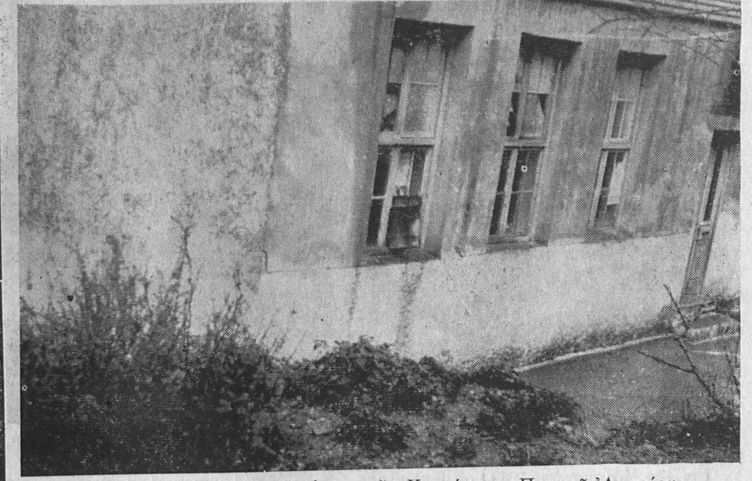
ΧΩΣΕ Αυτό έλέγετο Σχολείον τής Κοινότητος Πατσού Αμαρίου

Τοιουτοτρόπως, ή επαγγελία τού κ. πρωθυπουργού λαμβάνει σάρκα και όστα: «Η χώρα μας θά ήμπορή νά άντιπαραπαχθή πρὸς τας πλέον προηγμένας εις τό ύφορρό τήν παροχήν ύποστη-